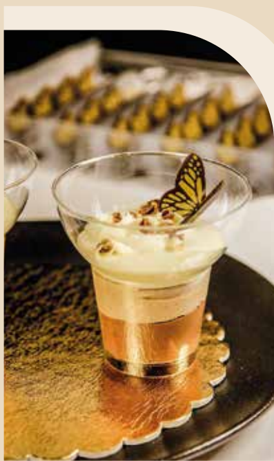
LILLY ČOKOLADA ART. I10476